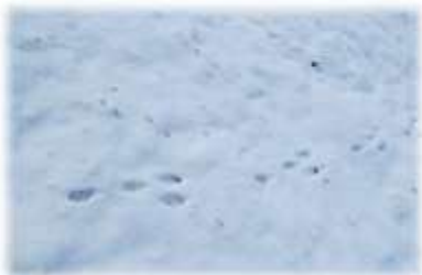
Kiškio pėdsakai sniege

Susitinkame prie Šaltojo karo ekspozicijos, automobilių stovėjimo aikštelėje. Keliaujame 3 km pėsčiomis Plokštinės pažintiniu taku. Aplankome gamtos paminklą – Pilelio šaltinį, apžiūrimė šikšnosparnių inkilus, stebime žvėrelių pėdsakus, susipažįstame su Žemaitijai būdingais eglynais ir jų gyventojais.