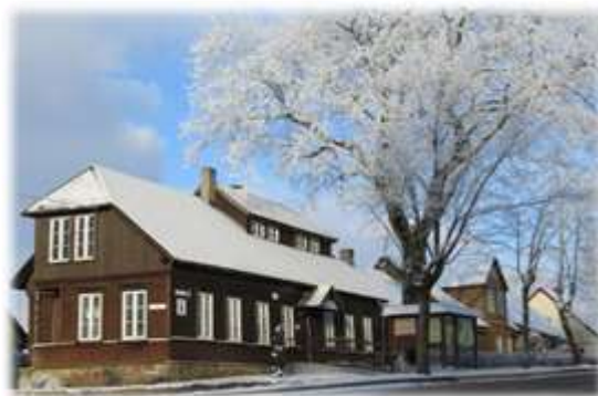
Žemaitijos nacionalinio parko Platelių lankytojų centras veikia ir šeštadieniais

Pasirašiusiems bendradarbiavimo sutartis su Žemaitijos nacionalinio parko direkcija, 1 edukacinis užsiėmimas per metus – nemokamai.